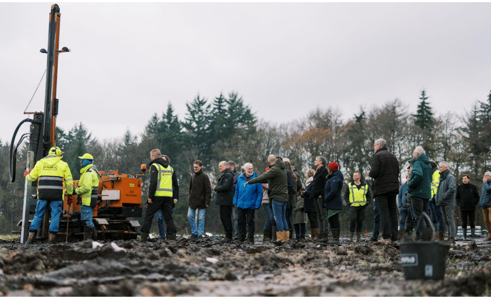
Foto: de eerste paal gaat in de grond bij Energietuin Assen-Zuid

De gemeente of in sommige gevallen de Regionale Uitvoeringsdienst (RUD) die per regio ingedeeld zijn, controleert of de uitvoering in lijn is met de omgevingsvergunning. Als je afwijkt van de vergunning dan kan je dat geld maar vooral ook tijd kosten.